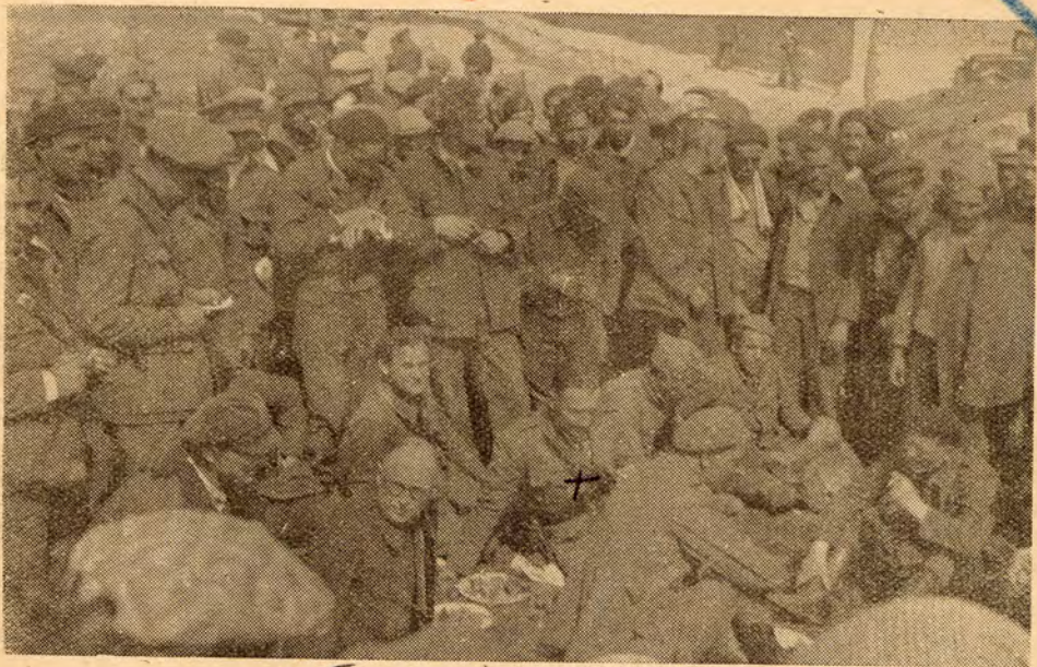
7 colonie e rifugi addebiati ritorno ai loro uffici comandanti